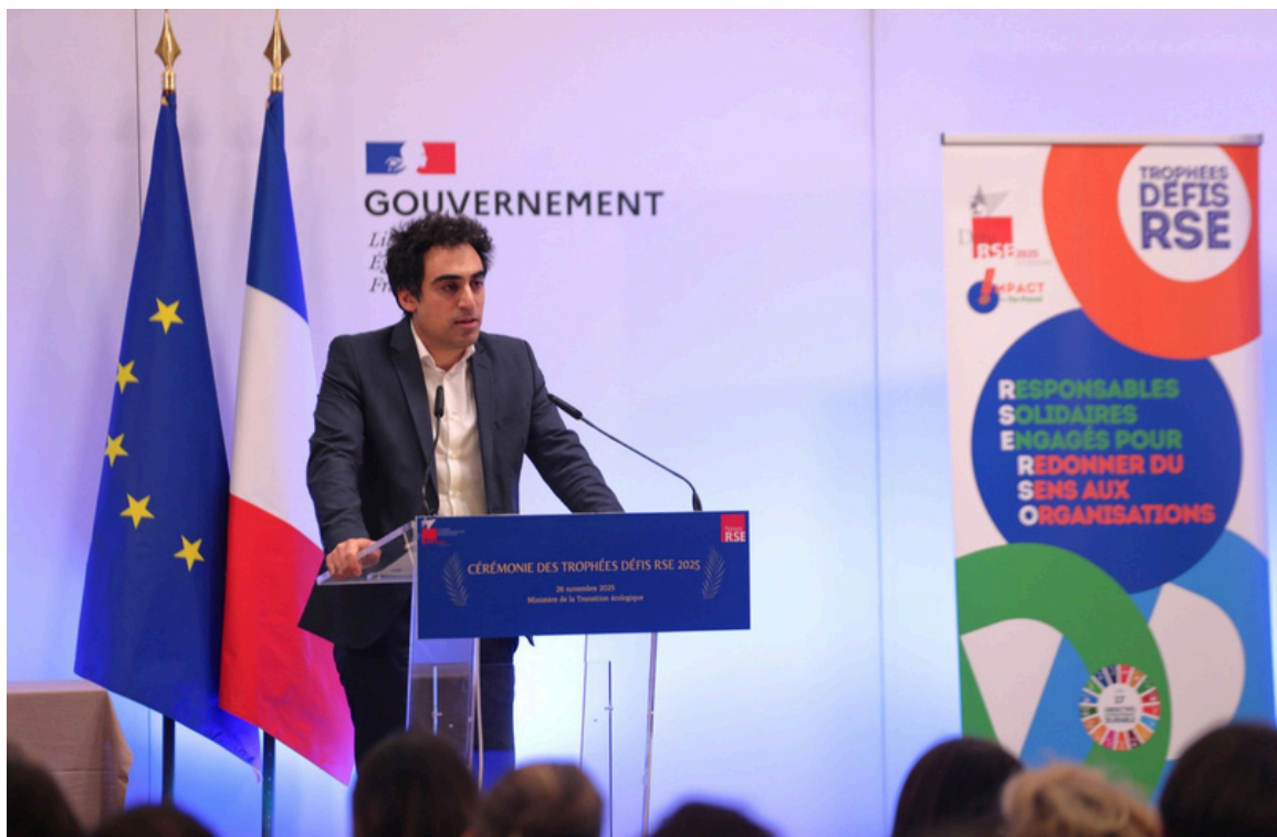
Cérémonie des Trophées Défis RSE-26 novembre 2025- Ministères Ecologie, Territoire, Transports, Ville et Logement