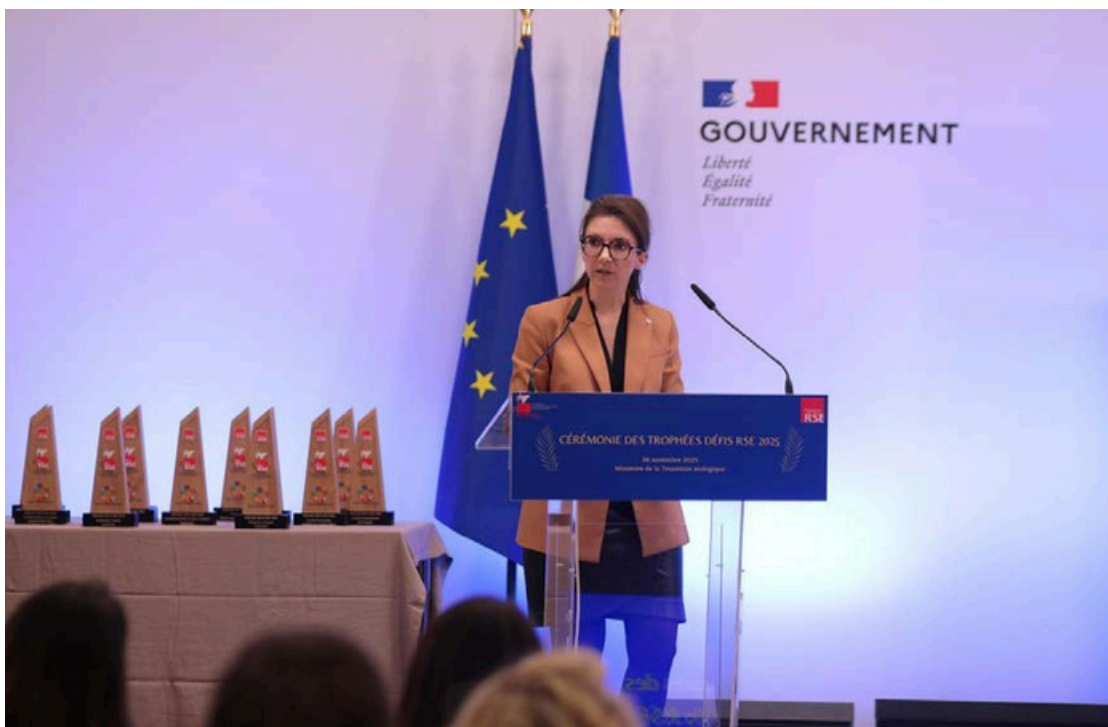
Cérémonie des Trophées Défis RSE-26 novembre 2025- Ministères Ecologie, Territoire, Transports, Ville et Logement

Aurore BERGÉ, Ministre déléguée auprès du Premier ministre, chargée de l'Égalité entre les femmes et les hommes et de la Lutte contre les discriminations