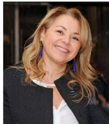
Fondatrice des Trophées Défis RSE

La responsabilité de tous face à la crise climatique, énergétique et sociale n'est pas une posture, ni une opinion mais un devoir vital : il n'y a plus de débat ou de tergiversations. Le réchauffement climatique et ses conséquences sur l'humanité se généralisent, impactant nos écosystèmes, nos territoires et leurs habitants, nos ressources naturelles, et déjà de nombreux secteurs d'activités. Les publics fragiles, vulnérables, paupérisés, et les femmes et les enfants en sont les premières victimes.