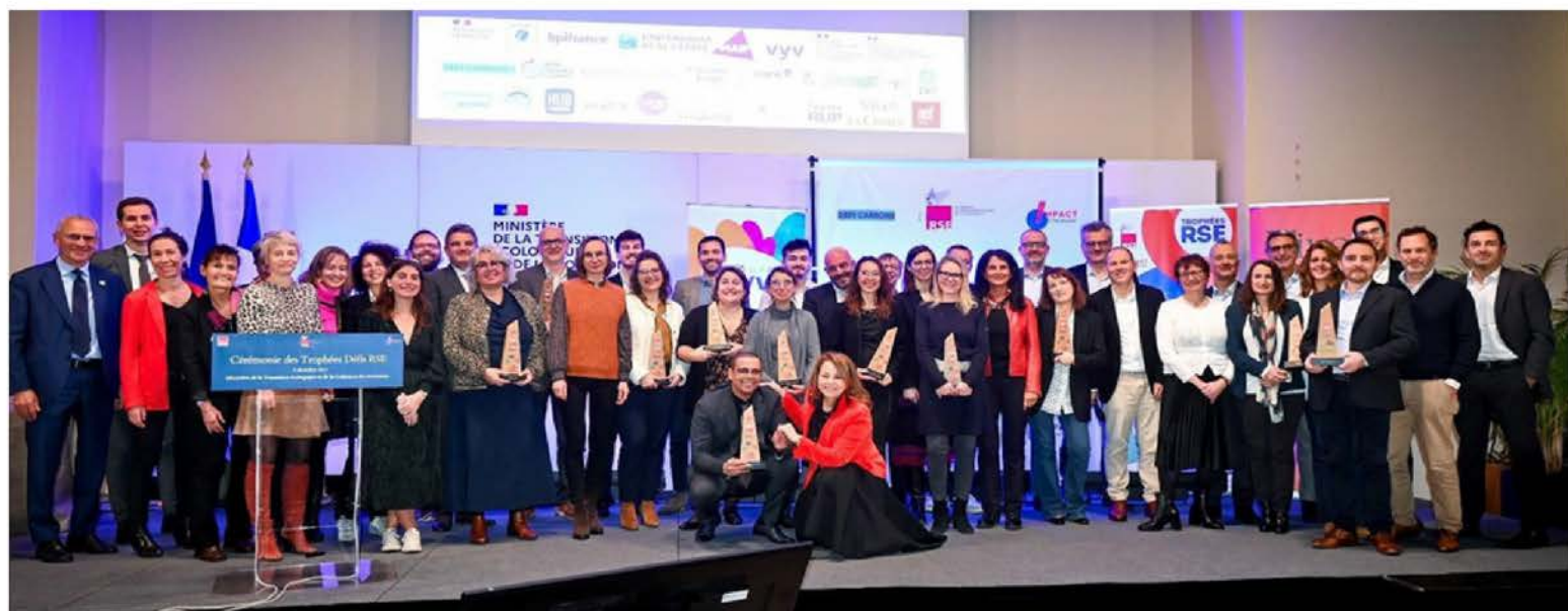
Lauréats des Trophées Défis RSE 2023 – Ministère de la Transition écologique et de la Cohésion des territoires - 6 décembre 2023