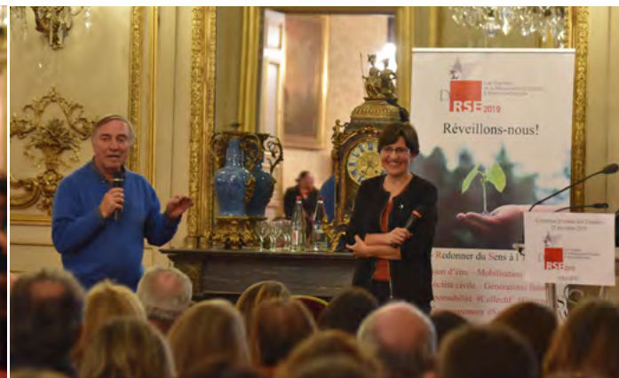
Cérémonie des Trophées Défis RSE au Sénat